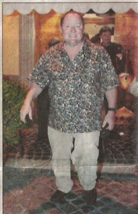
Il Premio Oscar John Lasseter